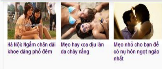
Hà Nội: Ngâm chân dài khoe dáng phở đêm | Meo hay xoa dịu làn da cháy nắng | Meo nhỏ cho bạn để có nụ hôn ngọt ngào nhất

Đúng 14h, hai bác sĩ đã có mặt aFamily để trả lời những thắc mắc của cha mẹ về sức khỏe mùa hè của các bé trong độ tuổi từ 1-5 tuổi.